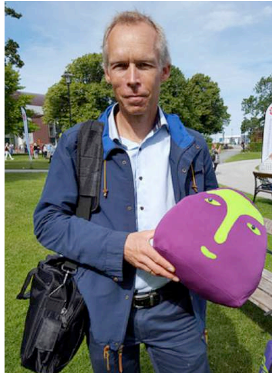
Chefen för Stockholm Resilience Centre Johan Rockström, här tillsammans med Vegonorms maskot Vegomårran.

Ta del av några av bilderna från våra aktiviteter