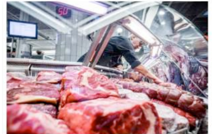
Mindre kött till Vegonormmarknaden i Almedalen.

http://www.dalademokraten.se/opinion/debatt/vi-kan-bryta-kottnormen